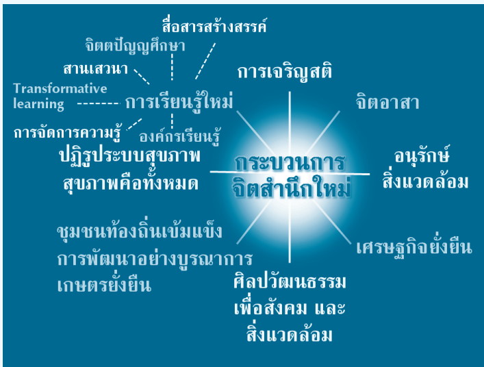
รูปที่ ๔ กระบวนการจิตสำนึกใหม่