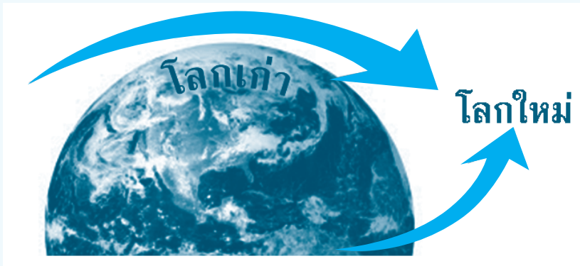
รูปที่ ๒ โลกเก่า กับโลกใหม่

เรากำลังเห็นปรากฏการณ์ ๒ อย่างเกิดขึ้นซ้อนกัน คือโลกที่เราอยู่นี้ ตั้งแต่มีมากำลังวิกฤตสุดๆ ขณะเดียวกันโลกใหม่ที่ไม่เหมือนเดิมกำลังผุดบังเกิดซึ่งอาจจะเขียนเป็นลายเส้นได้ดังนี้