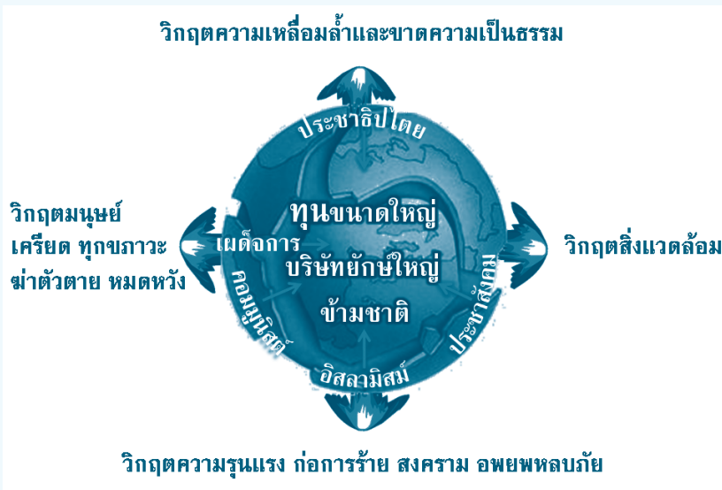
รูปที่ ๓ โลกเก่าที่กำลังปริแยกและวิกฤตยิ่ง

ทุนขนาดใหญ่และบริษัทยักษ์ใหญ่ข้ามชาติเป็นโครงสร้างใหม่ในโลก ที่ไม่เคยมีมาก่อน